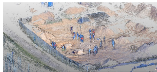
Abbildung 2: Gesamte Ausgrabungsstätte (3D-Laserscan)